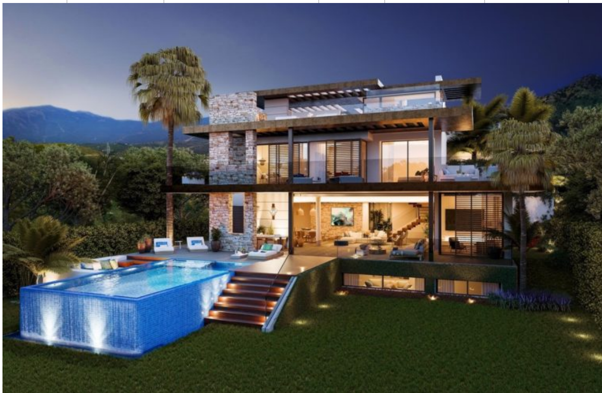
Recreación facilitada por la promotora.

La promotora Altur Homes ha lanzado en el municipio malagueño de Benahavís Be Lagom, el primer proyecto sostenible orgánico de España que ya cuenta con licencia de obra y que albergará 13 villas de lujo “concebidas y sensiblemente diseñadas mediante una inigualable combinación de materiales inspirados en las preferencias más valoradas actualmente: la sostenibilidad, la alimentación orgánica y la economía circular”.